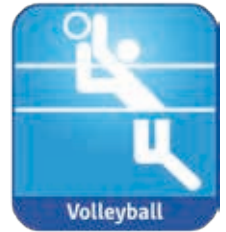
Volleyball Carolin Walasek volleyball@tus- hoellstein.de